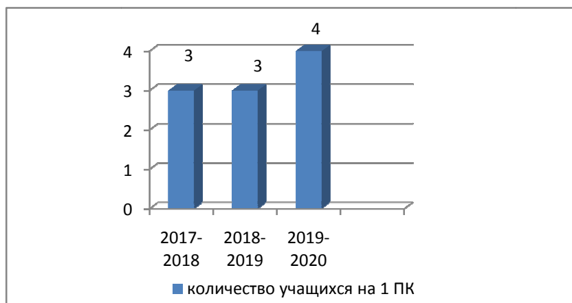
Диаграмма 1. Количество учащихся, приходящихся на один компьютер